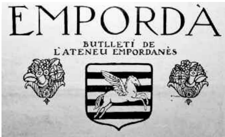
Detall de la capçalera d'Empordà, butlletí de l'Ateneu Empordanès de l'any 1918 (ACAE).

car els podem prometre per ben aviat si son amatents, un organisme que, dins de Barcelona, els assebenti de tot el que'ls faci menester aquí. Un organisme actiu, per a tota gestió que'ls convingui; una mena d'extensió consular de les municipalitats empordaneses... I gosem, per això, per elles mateixes i satisfacció pròpia demanar-los la seva inscripció en la llista de socis de l'Ateneu. Les quotes que paguin tindran per nosaltres regust de patrimoni, i com a tal, farem d'esmersar-lo dignament en profit de l'Empordà, dels seus fills i per la gloria que'l temps no podrà regatejar-nos".