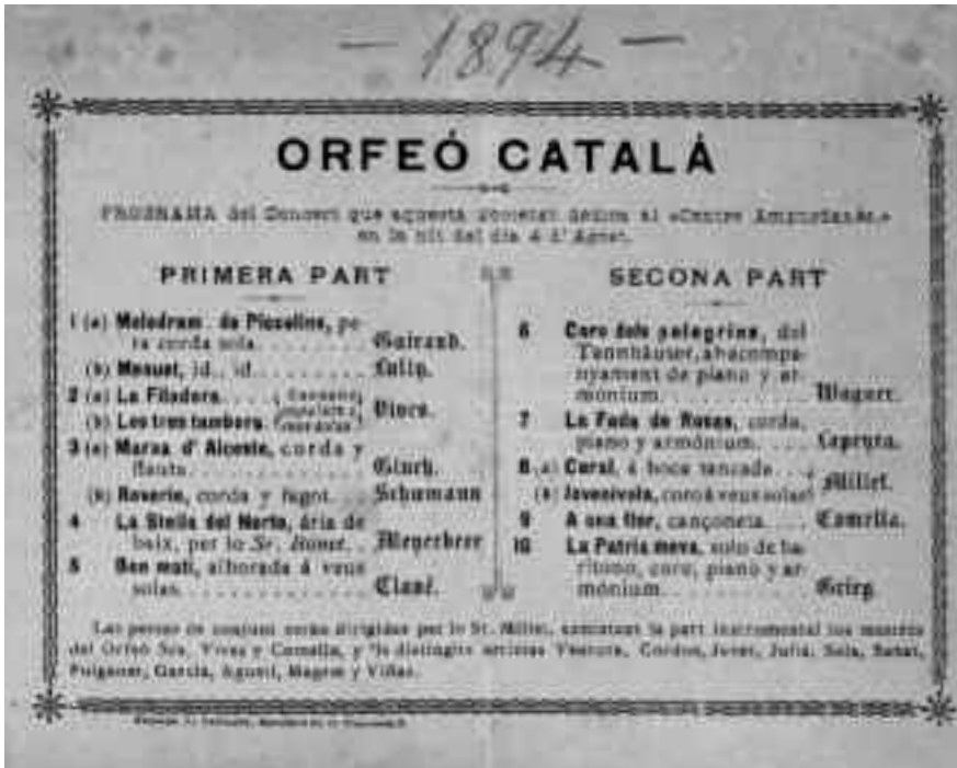
Programa del Concert de l'Orfeó Català dedicat al Centre Empordanès l'any 1894.

El local del carrer Dufort fou la seu de l'Orfeó fins l'any 1897, quan es traslladà al Palau Moxó de la plaça de Sant Just de Barcelona.